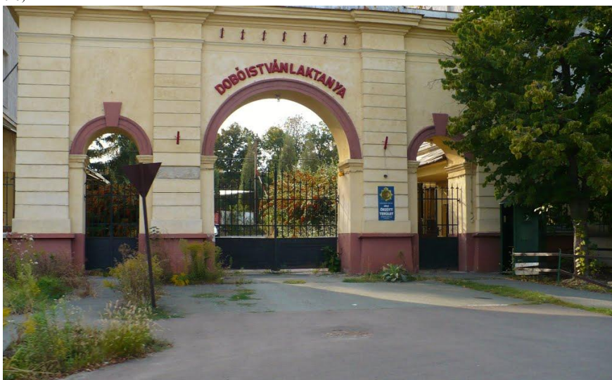
A volt Dobó István laktanya főbejárata